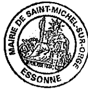
Sophie RIGAULT Maire de Saint-Michel-sur-Orge

Accusé de réception - Ministère de l'Intérieur